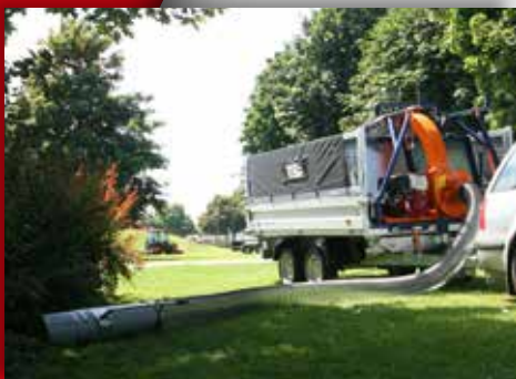
Für den Straßenverkehr entwickelt