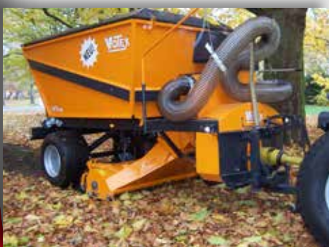
Auch für Golfbahnen geeignet

Motor: 9 PS Honda, luftgekühlt, GX270, 4-Takt Zulässiges Gesamtgewicht 3500 kg Netto-Nutzlast 2550 kg Größe (L x B x H) 452 x 190 x 121 cm Behälterinhalt 4,5 m 3 Geräuschpegel (LpA) 91 dB(A) Zulässige Höchstgeschwindigkeit 100 km/h