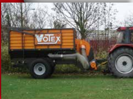
Für den Einsatz von Frühjahr bis Winter entwickelt

Mindestl. Zapfwelle 33,0 kW (40PS) Zapfwelldrehzahl 540 U/min Netto-Nutzlast 1490 kg Größe (L x B x H) 480 x 180 x 230 cm Behälterinhalt 4,2 m 3